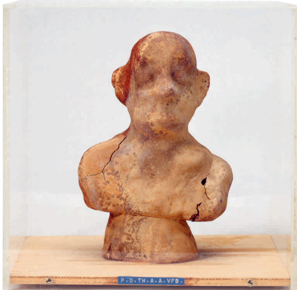
19.8. – 6.11. 2011 Dieter Roth P.O.T.H.A.A.V.F.B. (Portrait of the artist as Vogelfutterbüste), 1968